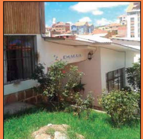
SUCRE: Calle Padilla N° 526, Zona Central Telf/Fax: 6914706