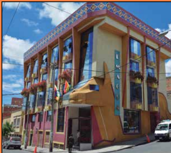
LA PAZ: Calle José Saravia Esq. Pioneros de Rochdale N° 1600 , Zona Alto San Pedro - Teléfonos: 2488886 / 2489439 / 2486493 - Fax: 2494599

Las nuevas direcciones de EMAGUA en estas dos ciudades, son: