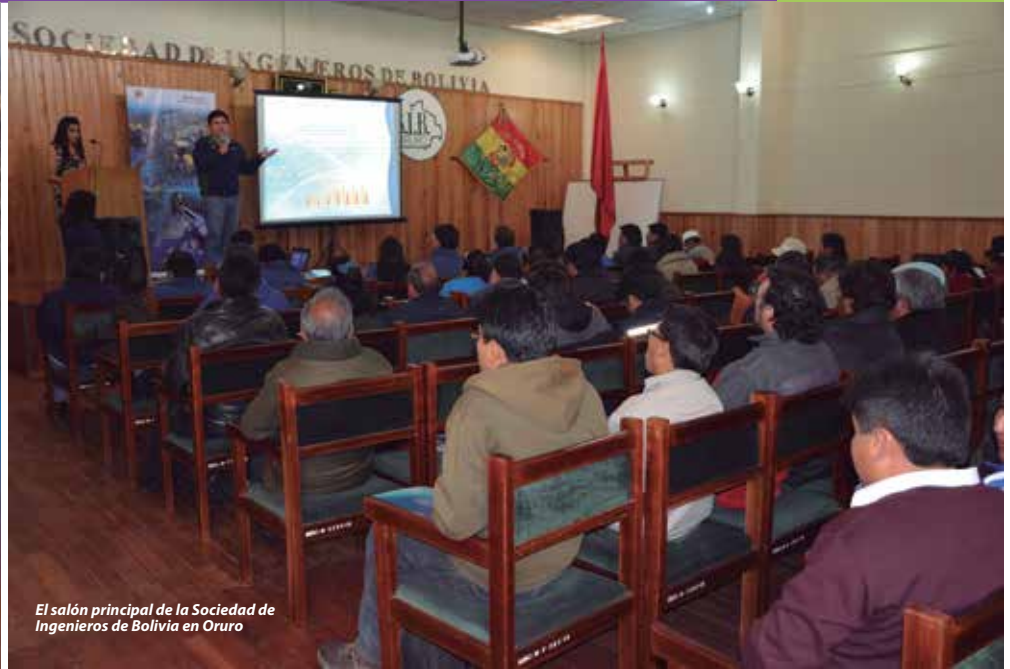
El salón principal de la Sociedad de Ingenieros de Bolivia en Oruro

La Entidad Ejecutora de Medio Ambiente y Agua (EMAGUA) realizó la Audiencia Pública Final de Rendición de Cuentas de la Gestión 2015, en estricto cumplimiento a las leyes del Estado Plurinacional de Bolivia.