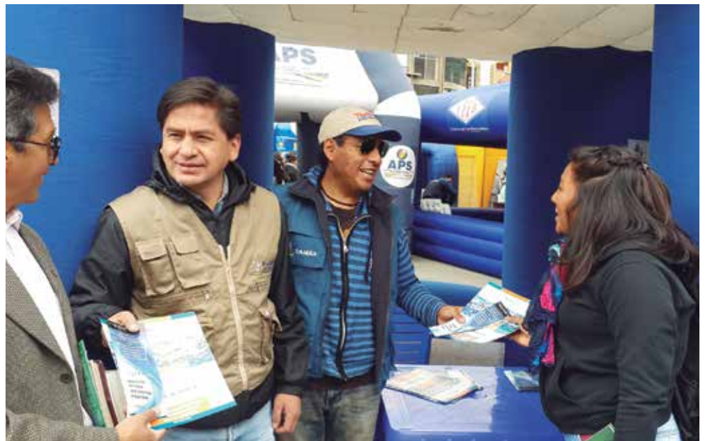
El público asistente recibe información de los funcionarios de EMAGUA, en la Feria de las Unidades de Transparencia realizada el mes de diciembre de 2015.

Este evento hizo posible la interacción directa con la población a objeto de dar a conocer y difundir la labor encadrada por EMAGUA y otras instituciones públicas preocupadas por establecer mecanismos cada vez más efectivos para luchar contra el flagelo de la corrupción.