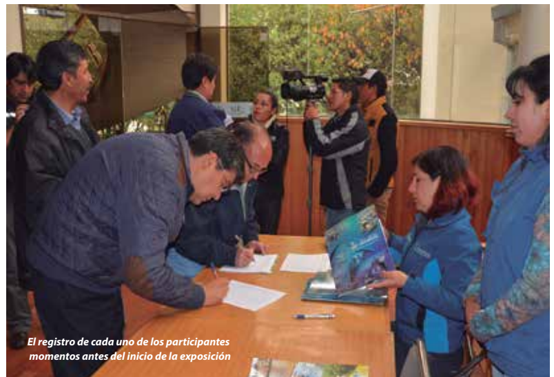
El registro de cada uno de los participantes momentos antes del inicio de la exposición